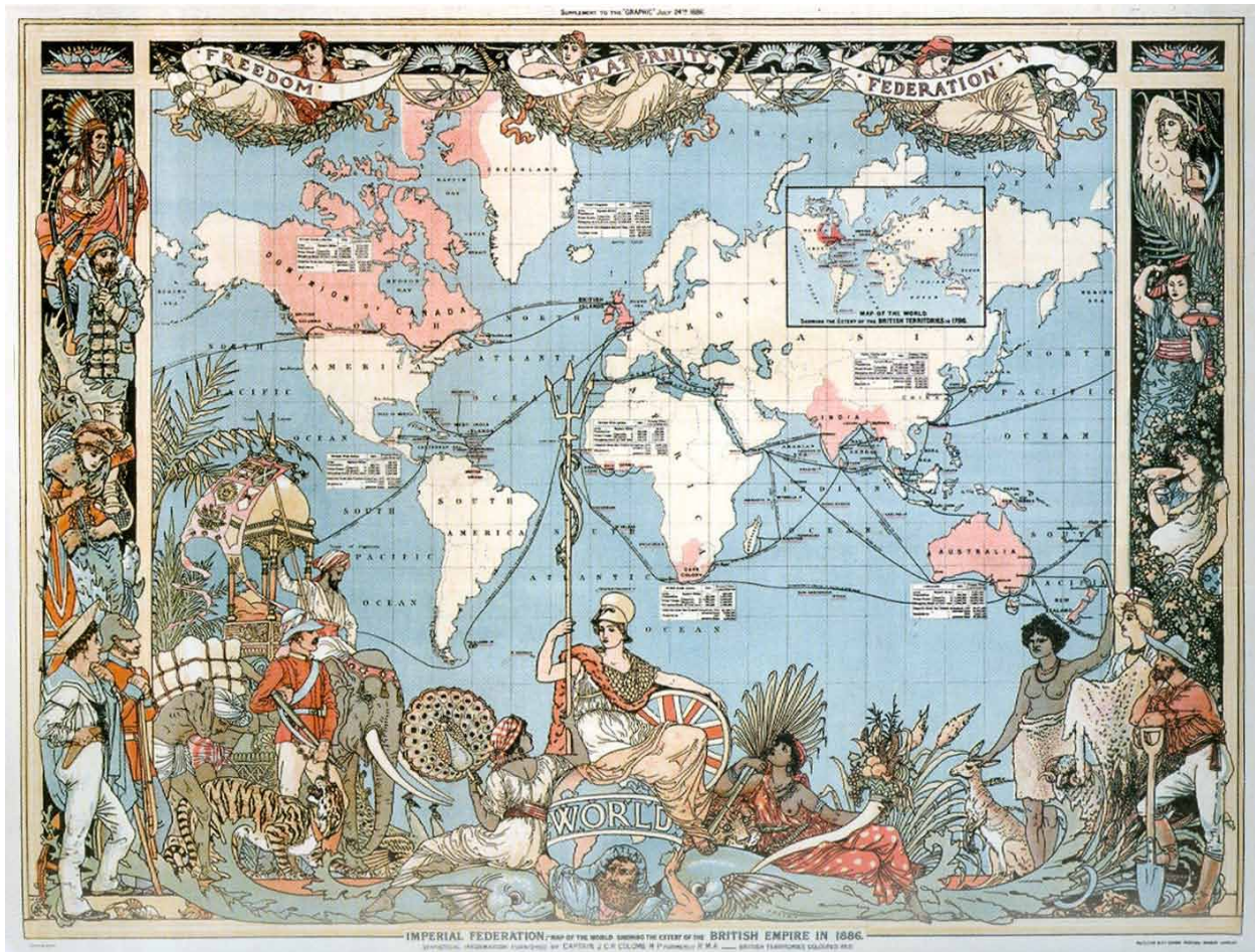
Lähde: Walter Crane, Map of the world showing the extent of the British Empire The Graphic 24.7.1886