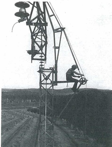
Jaana Iso-Markku ja Sirpa Kähkönen, Valoa ja varjoa. 90 kuvaa Suomesta (2007)